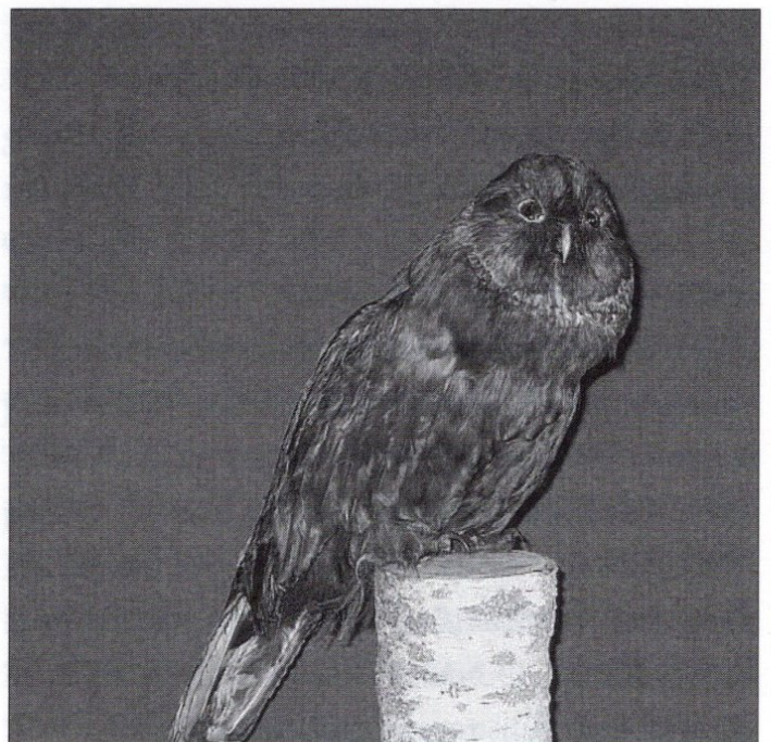
Obr. 4 / Fig. 4: Puštík bělavý ( Strix uralensis ) v NZM v loveckém zámku Ohrada v Hluboké n. Vlt. (inv. č. 44716) / Ural Owl ( Strix uralensis ) in National Agriculture Museum in the hunting lodge Ohrada in Hluboká n. Vlt. (catalogue Nr. 44176)

* 78507 coll. Kožina; puštík obecný ( Strix aluco ): * 40106 VIII. 1933 pull. a ad., coll. Ko * 40190 VI. 1934, juv. (cca 2 měs., přepeřuje z prach. šatu), coll. Ko * 40191 V. 1934, pull. (cca 6 dnů), coll. Ko * 42048 coll. Ho * 42049 coll. Ho * 44708 Hluboká n. Vlt., 1887, F, coll. O * 44709 Třeboň 11. 10. 1849, leg. Ad. Schwarzenberg, coll. O * 44710 Kadaň, 14. 1. 1917, F, coll. Hi * 60835 1962, F, prep. F. Sitar, coll. S * 64002 coll. Nečas * 64003 coll. Nečas * 64004 Pouště, 3. 12. 1940, F, pull, coll. Nečas * 64005 Pouště, 20. 5. 1940, M, pull. (13 dnů), coll. Nečas * 64220 Opatovice, 6. 11. 1933, coll. Ko * 64221 Opatovice, 1940, juv., coll. Ko * 64222 coll. Ko * 64429 coll. Kožina, Špička * 64546 juv., coll. Kožina * 76275 Zbraslav n. Vlt., 21. 11. 1947, F, coll. St; puštík bělavý ( Strix uralensis ): * 2108 Karpaty, Slovensko, M, coll. Kr * 2109 Karpaty, Slovensko, F, coll. Kr * 40107 II. 1930, coll. Ko * 44711 coll. O * 44712 Č. Krumlov, 1890, coll. O * 44713 juv., coll. O * 44714 juv., coll. O * 44715 juv., coll. O * 44716 Stožec, 26. 7. 1880, leg. Ad. Jos. Schwarzenberg, coll. O (obr. 4) * 44717 Č. Krumlov, coll. O * 64227 coll. Ko * 64364 1938, M, coll. Ko; sýček obecný ( Athene