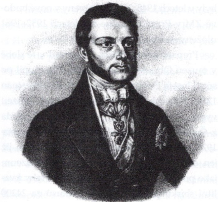
Obr. 1 / Fig. 1: Jan Adolf II. Schwarzenberg, zakladatel muzea Ohrada / Jan Adolf II. Schwarzenberg, the founder of museum in Ohrada

W. Adolf Fürst zu Schwarzenberg, Herr von Wagram etc. Nobilität des kaiserlichen Österreichs