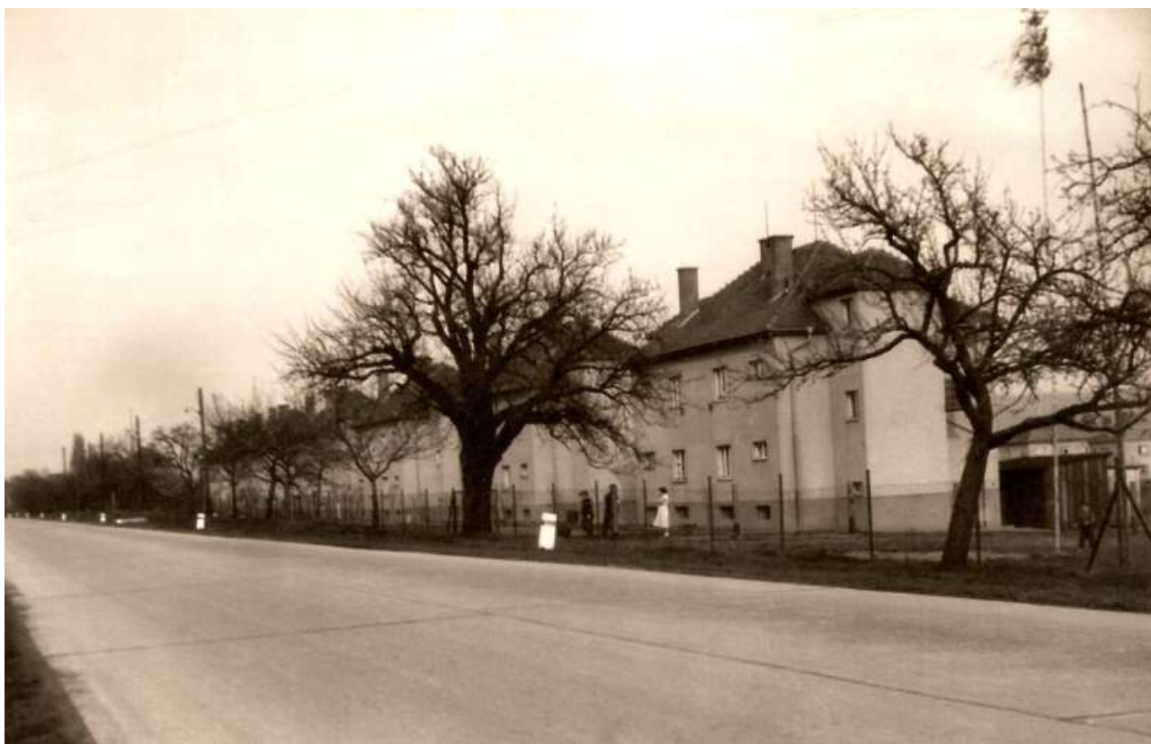
SOLO domky v Tyršově ulici

materiálu. Roku 1971 postavil podnik SOLO v Lipníku další dům, tentokrát s 15 bytovými jednotkami. Na počátku 70. let došlo k vybudování nové mazutové kotelny (v roce 1972 byl uveden do provozu jeden kotel, druhý o rok později, dodavatelem byla ČKD Tatra Kolín). Lipenský podnik SOLO dodával dálkově teplo ze své kotelny i pro sídliště v Bratrské ulici, postavené ve 2. polovině 60. let. V 1. polovině 70. let byla v areálu podniku vystavěna nová čistička odpadních vod a odstraněn havarijní stav kanalizace, do provozu byla uvedena v polovině roku 1974. Na konci roku 1974 byl dokončen sklad hořlavin. V roce 1976 měl podnik v Lipníku přes 70 bytů, další přibýly na počátku 80. let v Tyršově ulici (v roce 1984 to bylo celkem 88 bytů). Stavební úpravy podniku probíhaly také po požáru v roce 1986. Záhy po převzetí sirkárny společností Moragro byly zrušené jesle přestavěny na pekárnu. Kvůli havarijnímu stavu budovy a špatným hygienickým podmínkám pak byl provoz uzavřen v roce 2002. K plánované rekonstrukci však nedošlo a hlavní tovární budova byla na jaře 2007 zdemolována.