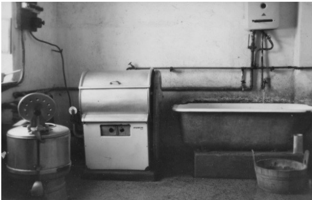
Závodní prádelna vznikla v 50. letech

Vedení továrny a ústředí společnosti se poměrně dobře staralo o své zaměstnance. V rámci 10. výročí vzniku ČSR byl úředníkům továrny vyplacen jako jubilejní dar navíc měsíční plat, dělníkům pak týdenní mzda. V roce 1929 byly pořízeny stojany na kola pro dojíždějící zaměstnance, kterých bylo kolem 40. Když si v roce 1933 řada zaměstnanců stěžovala na průvan v továrně (způsobený hlavně ventilátory u sušáren), byla učiněna různá opatření, která průvan výrazně omezila. Během obou světových válek a v době hospodářské krize a omezení výroby byly zaměstnancům vypláceny různé drahotní příplatky, ošacovací příplatky (tyto výhradně jen úředníkům), v příznivějších dobách pak různé odměny. Například v období 1. republiky dostávali úředníci, zřízenci a kvalifikovaní dělníci během prosince speciální příplatek k platu, tzv. novoročné. V případě ředitele se v roce 1935 jednalo o 6 150 Kč (roku 1922 to bylo 4 000 Kč), mezi něj a 7 úředníků tak bylo rozděleno 20 060 Kč. Dělníci dostávali speciální vánoční výpomoc méně často, např. v roce 1938, kdy jim byla přidělena i mimořádná podzimní výpomoc ve výši od 85 do 250 Kč.