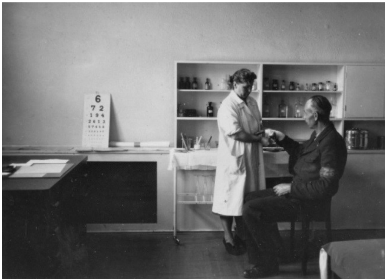
Ošetření pracovního úrazu v závodní ošetrovně

14 úrazů. Bohužel také z této doby jsme zpraveni o smrtelném úrazu. Dne 28. ledna 1961 došlo v lipenské sirkárně k smrtelnému úrazu jednoho dělníka na skládce kulatiny. Zabil ho kmen uvolněný při nakládce.