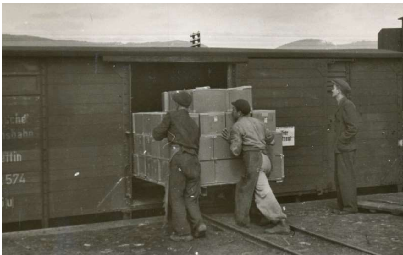
Nakládání zabalených krabiček se zápalkami ve 40. letech 20. století

Lipenská sirkárna vždy vyvážela do ciziny jen menší část své produkce. V určitých obdobích (např. v letech 1936–1940) na export nedodávala vůbec žádné zápalky. Po 2. světové válce došlo k potvrzení již staršího rozdělení výroby sušické a lipenské sirkárny. Ta první vyráběla hlavně na export, domácí poptávku pak měl uspokojovat lipenský závod nového národního podniku. Například v roce 1946 se Lipník podílel na dodávce dřevěného drátu do Švýcarska, v roce 1947 činil export zápalek 23 % celkové výroby, v roce 1951 dokonce 38,4 %, v roce 1955 dodala lipenská sirkárna do zahraničí 17,7 % svých výrobků, v roce 1957 to ale byla už jen 3 %.