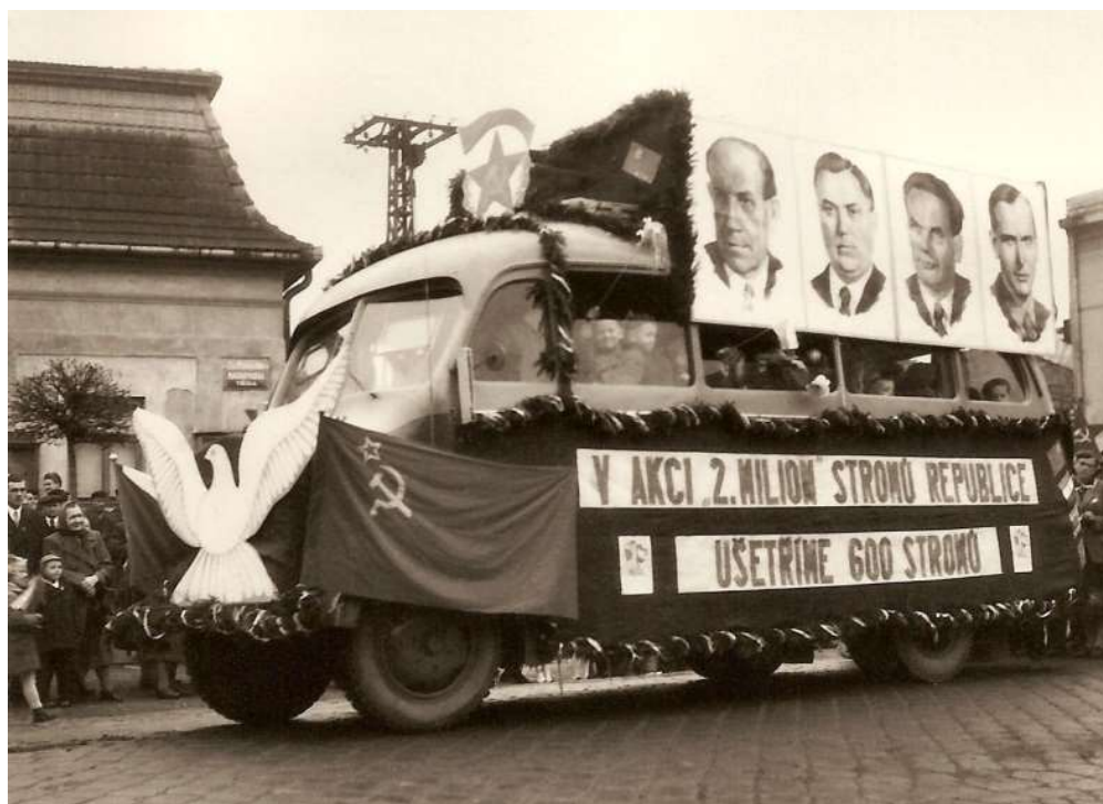
1. máj v Lipníku v roce 1954