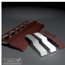
BB-P balkónová lišta priama