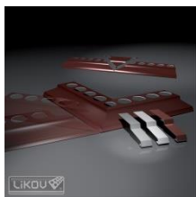
BB-R balkónová lišta rohová