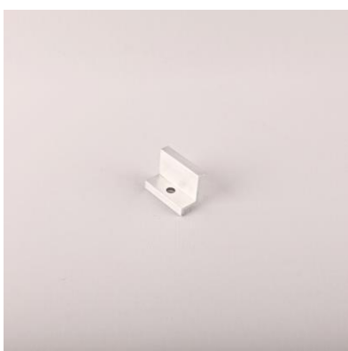
KUAL - krajový úchyt AL