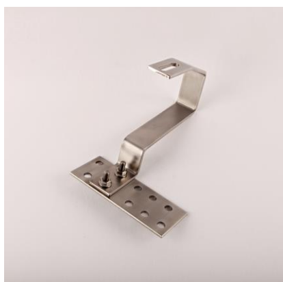
HŠ - střešní hák šroubovaný