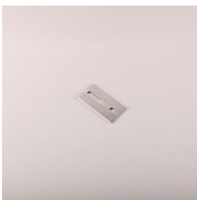
PR - AL praporec pro kombi šrouby