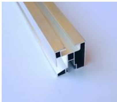
AL profil 45×40, délka 4,3m