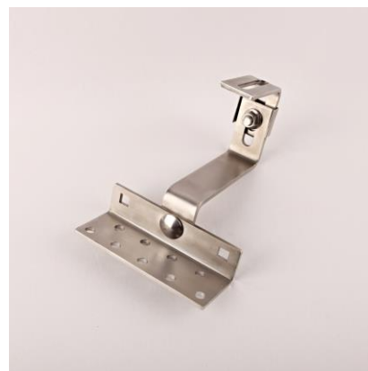
H2S - střešní hák 2×stavitelný