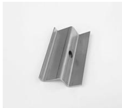
KUN - krajový úchyt nerez