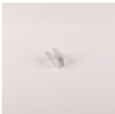
SUAL - středový úchyt AL