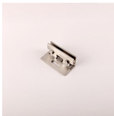
Úchyt - úchyt falcová střecha