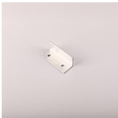
SPV - AL spojka pro profil 45×40