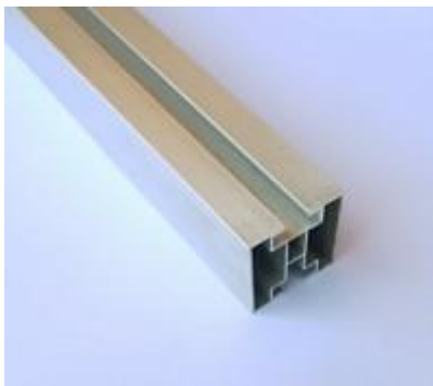
AL profil 50×45, délka 4,3m