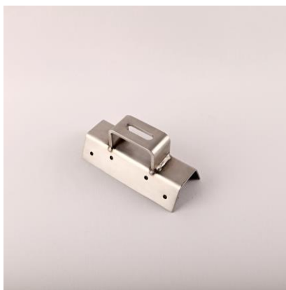
SDTR - střešní držák trapéz