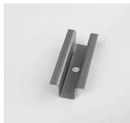
SUN - středový úchyt nerez