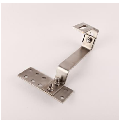
HŠS - střešní hák šroubovaný, stavitelný