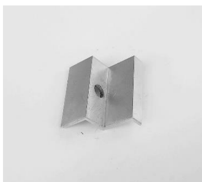
KUAL - krajový úchyt AL