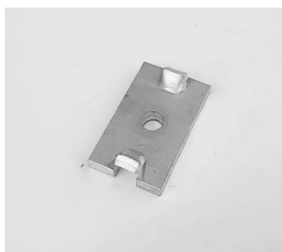
SUP - středový úchyt "P"