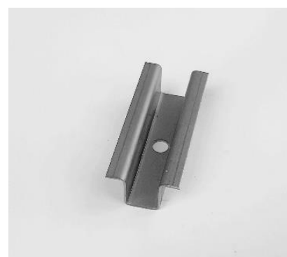
SUN - středový úchyt nerez