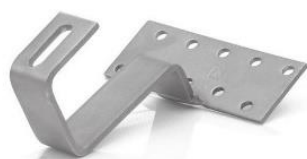
HZ - střešní nerez hák základní