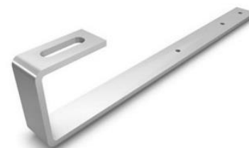
HJ - střešní nerez hák jednoduchý