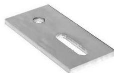
PR - AL praporec pro kombi šrouby