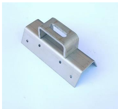
SDTR - střešní držák trapez